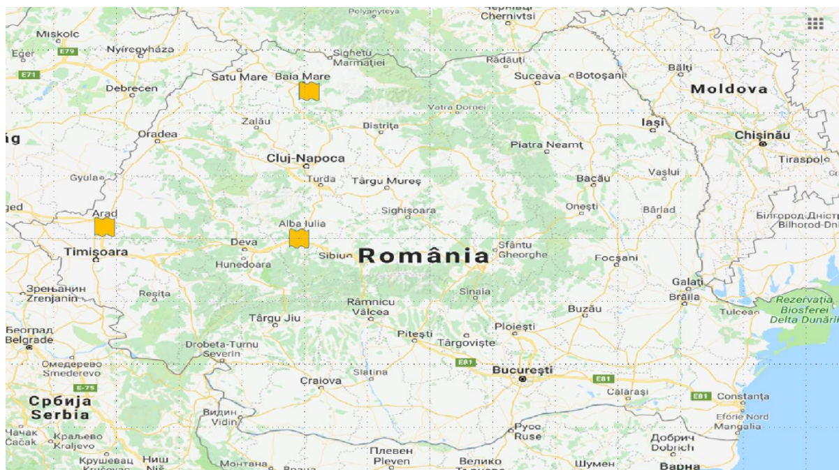
Fig. 2. - Locatiile in care RNSRM a detectat Ru-106 in data de 03.10.2017, prin gamma spectrometrie

Nota: Directia vantului – de la est la vest. Ru-106 a fost detectat in vestul tarii si nu a mai fost detectat in partea de est a tarii.