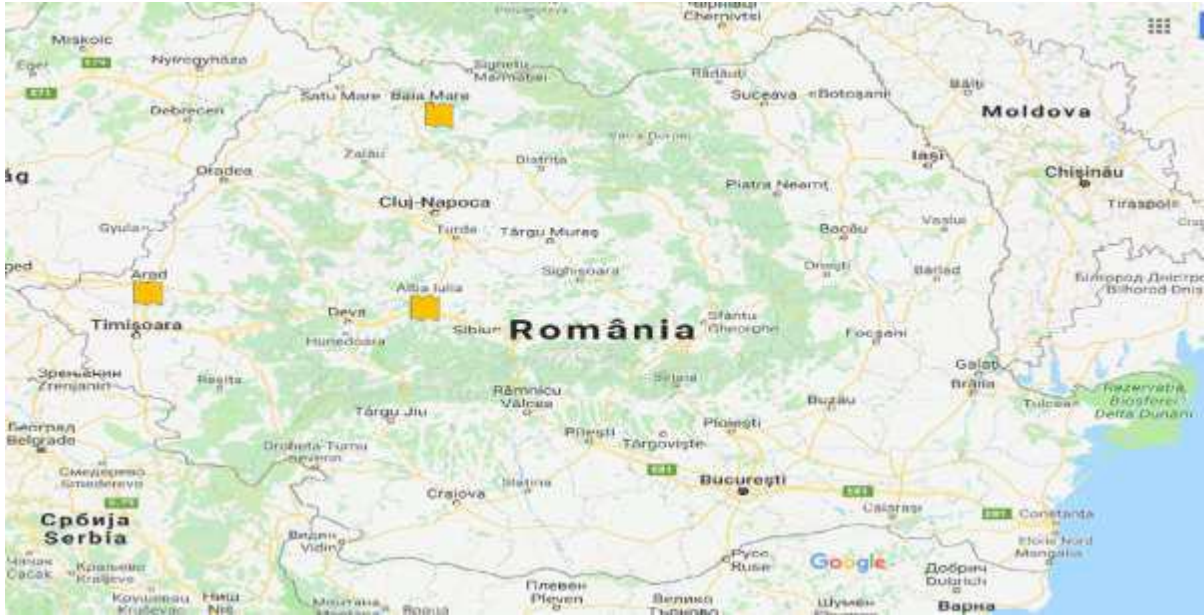
Fig. 2 Locations where Ru-106 was detected by RNSRM on 03.10.2017, through gamma spectrometry

Note: Wind direction was from E to W, detections were made in the West of the country and there were no detections in the East of the country.