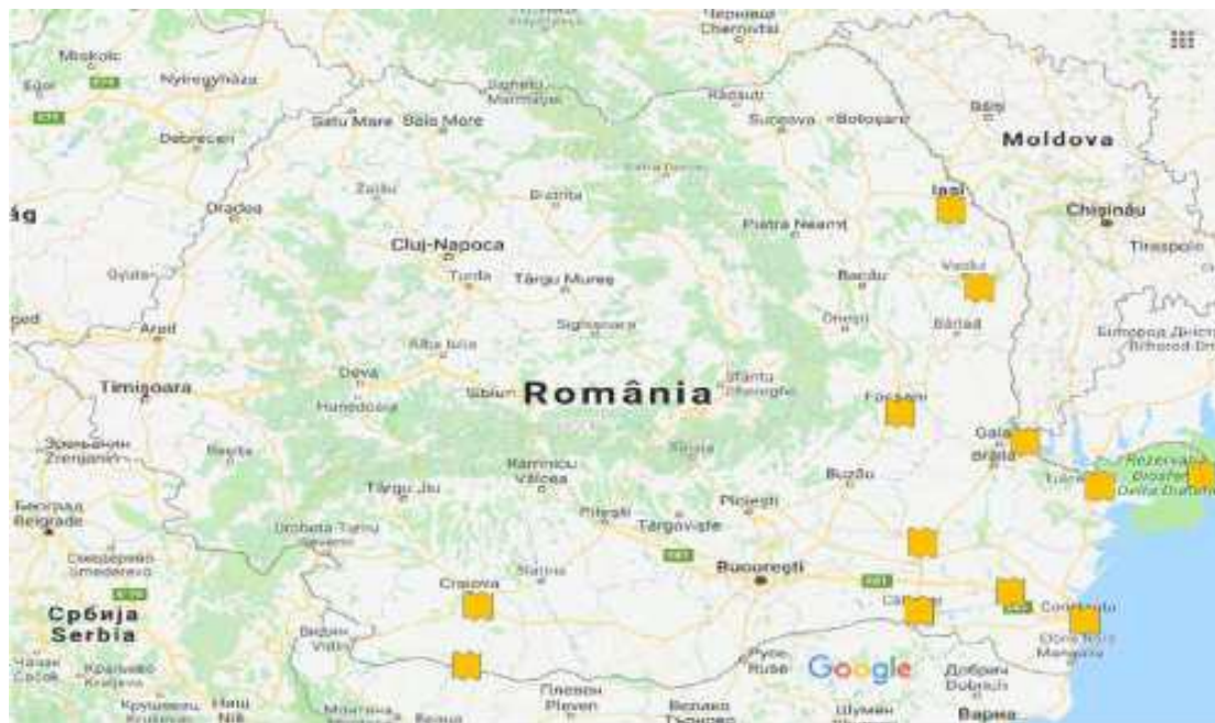
Fig. 1 Locations where Ru-106 was detected by RNSRM on 29.09.2017, through gamma spectrometry

Note: Wind direction was from E to W, detections were made in the East of the country and there were no detections in the West of the country.